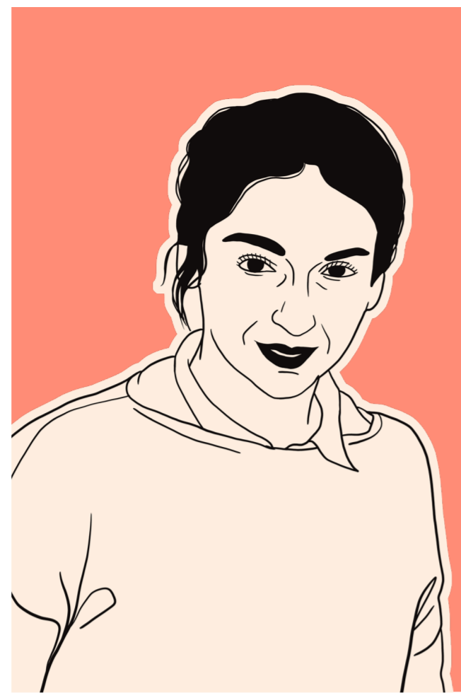
(1937, Mendrisio – 2012, Zurich) Flora Ruchat-Roncati architecte

Architecte tessinoise de renom, elle s'impose dans les années 1970 comme une figure majeure de l'architecture suisse. En 1985, elle devient la première femme professeure ordinaire à l'ETH Zurich, où elle enseigne jusqu'en 2002.