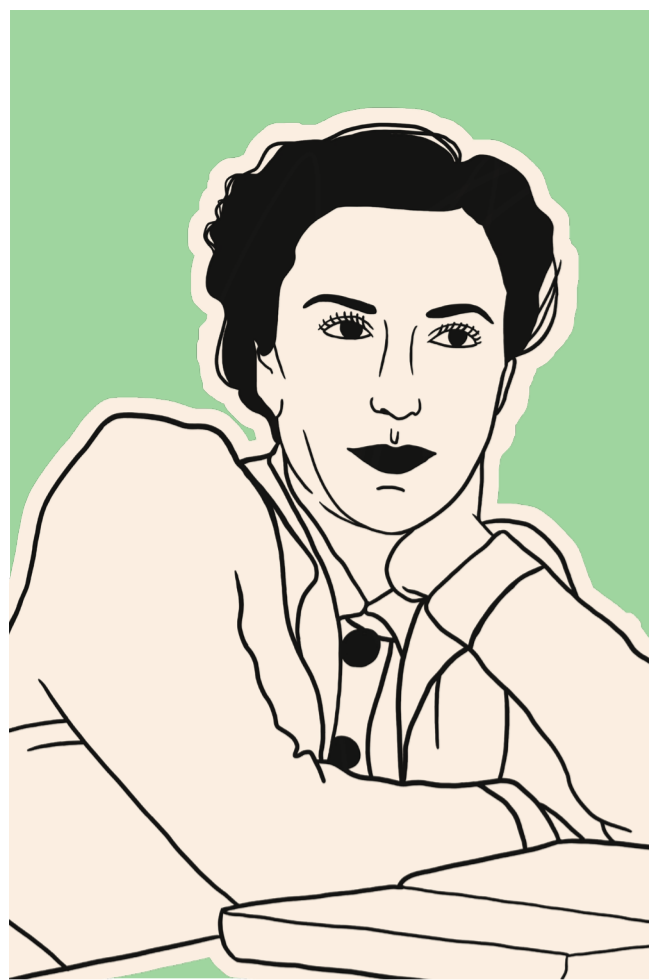
(1901, Rovray – 1988, Genève) Alice Rivaz écrivaine, romancière

Figure majeure de la littérature romande du XX e siècle, elle fait entendre la voix des femmes et des humbles à travers une œuvre marquée par sensibilité, indépendance et engagement. Écrivaine et journaliste pendant la guerre, elle reçoit plusieurs prix littéraires, dont le Prix Schiller. Parmi ses romans emblématiques: Comme le sable (1946) et La Paix des Ruches (1947).