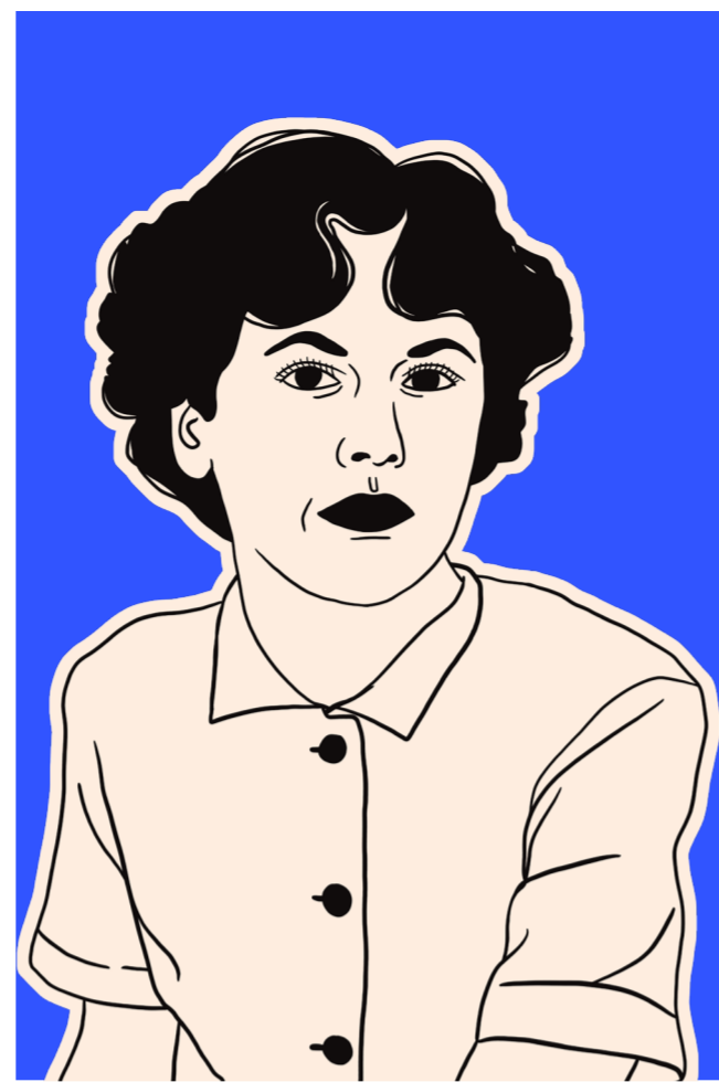
(1917–1990, Bâle) Iris Von Roten juriste, journaliste

Architecte tessinoise de renom, elle s'impose dans les années 1970 comme une figure majeure de l'architecture suisse. En 1985, elle devient la première femme professeure ordinaire à l'ETH Zurich, où elle enseigne jusqu'en 2002.